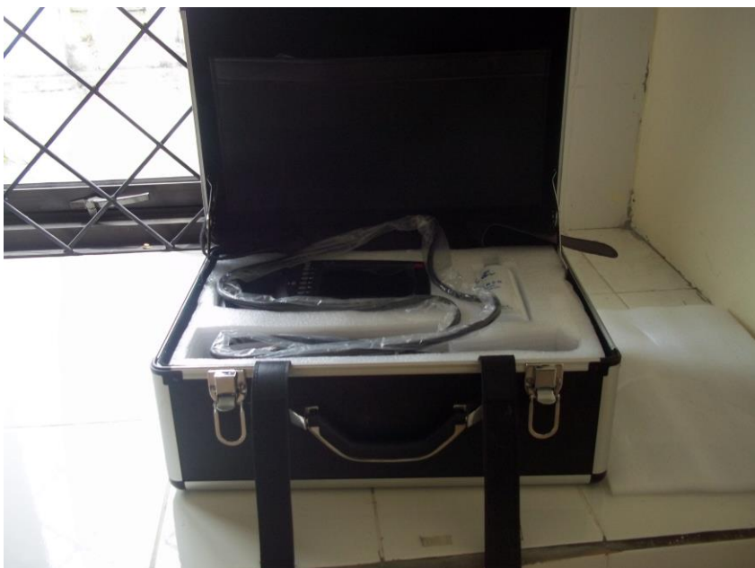
Animal USG Mobile