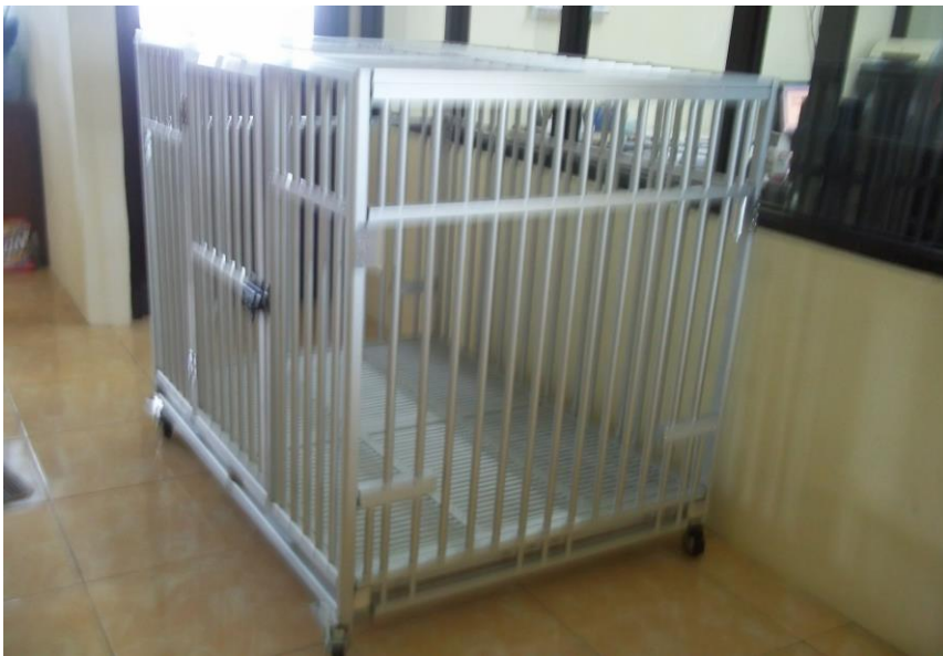
Kandang Observasi Kecil