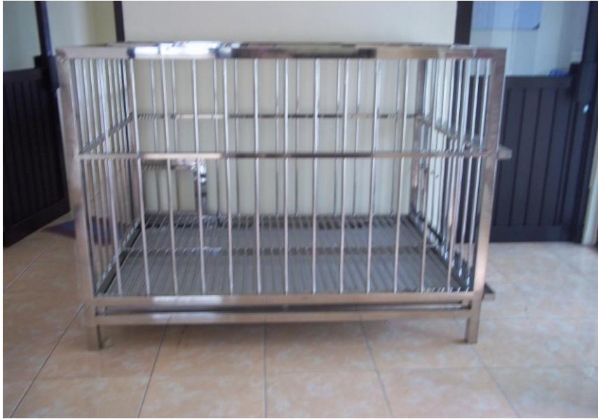
Kandang Observasi Besar