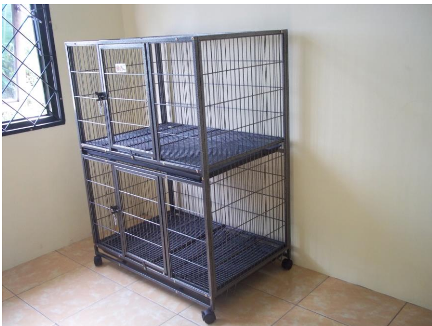
Kandang Susun Anjing/Kucing